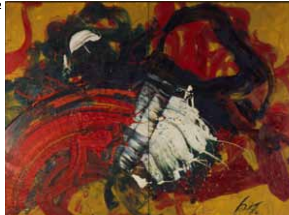
1 津高和一《アシタハキノウニナル》1964 (昭和39)年 油彩、キャンバス 193.0×129.8cm 2 白髪一雄《平治元年十二月二十六日》1966 (昭和41)年 油彩、キャンバス 273.0×363.8cm 3 長谷川潔《時・静物画》1969 (昭和44)年 メソチント、紙 26.5×35.8cm 4 黒崎彰《時の軌跡》1981 (昭和56)年 木版、紙 79.7×55.1cm 5 吹田文明《銀河の創世》1982 (昭和57)年 木版、紙 68.5×60.0cm